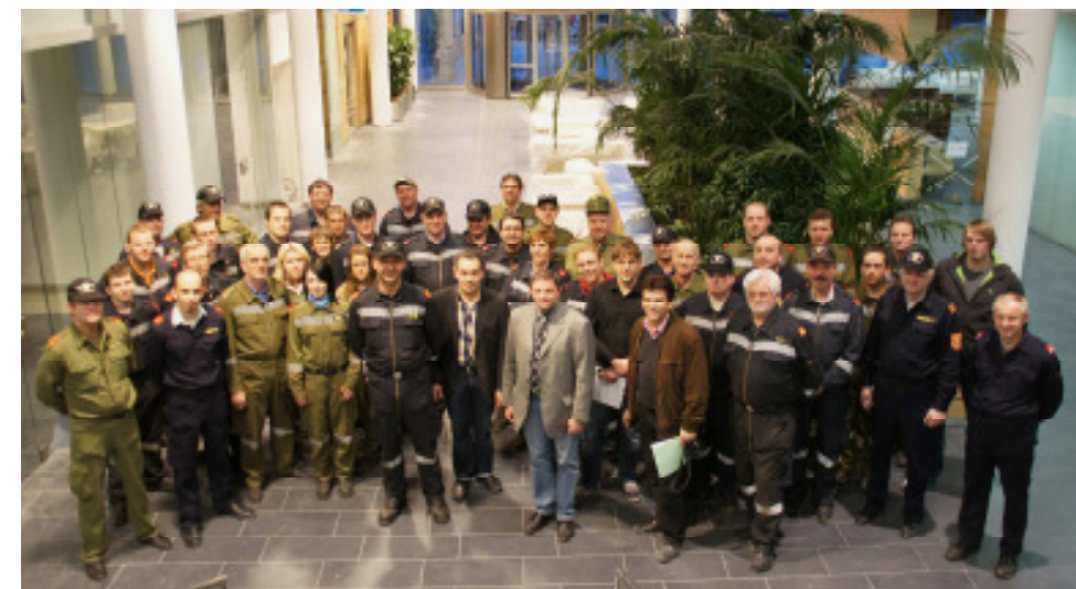
Die Mitglieder der Feuerwehren Zwettl-Stadt, Moidrams und Stift Zwettl bei der Begehung des Krankenhaus-Zubaus.

Krankenhaus-Zubau von Feuerwehren besichtigt