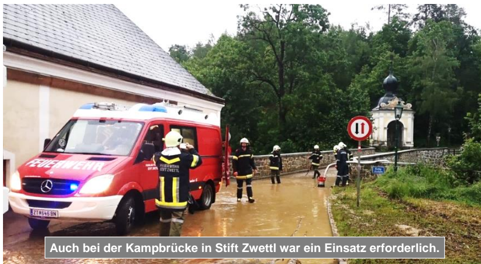
Auch bei der Kampbrücke in Stift Zwettl war ein Einsatz erforderlich.

Zu einigen Feuerwehreinsätzen führten sintflutartige Regenfälle am 7. Juni am späten Nachmittag. Viele Haushalte waren in der Waldrandsiedlung davon betroffen, drei davon benötigten die Hilfe der Feuerwehr um aus den überfluteten Kellern das Wasser abzupumpen. Das Kanalsystem hatte die enormen Regenmengen nicht mehr bewältigen können und das Wasser in die Häuser gedrückt. Die Feuerwehr Stift Zwettl war mit 8 Mann und beiden Fahrzeugen ca. 2 Stunden im Einsatz.