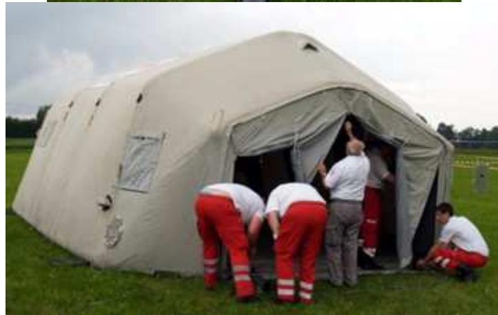
Die Sanitätsversorgung durch das Rote Kreuz Zwettl - Danke!