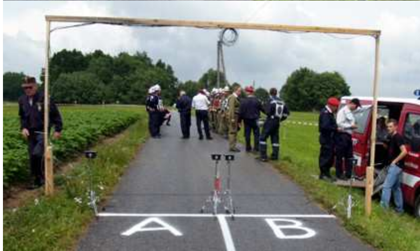
Die Elektronische Zeitnehmung (Start und Ziel)...