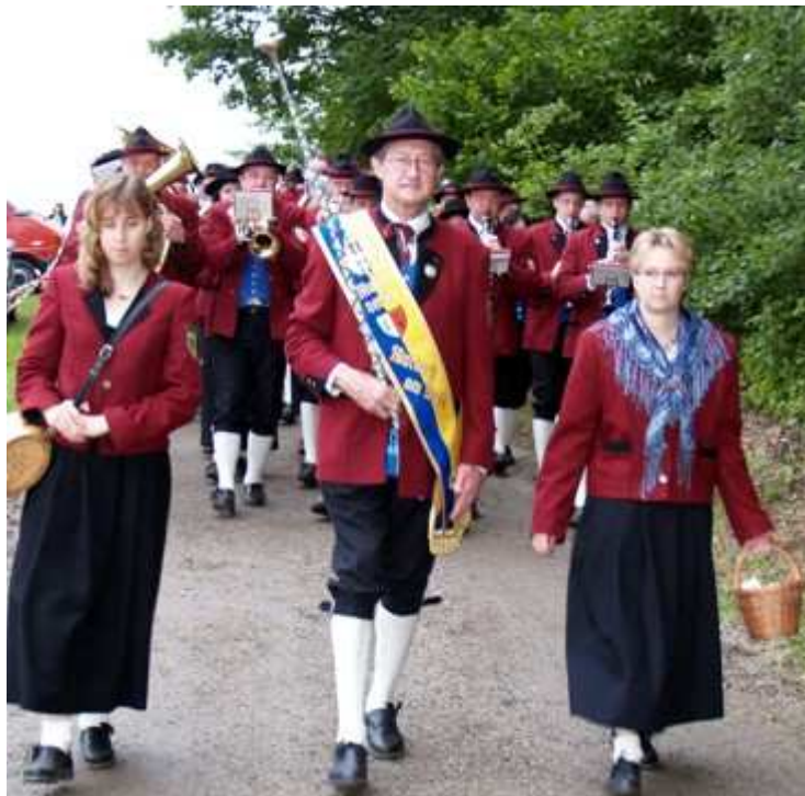
Dank an die Musikkapelle Marbach/Walde für die musikalische Begleitung