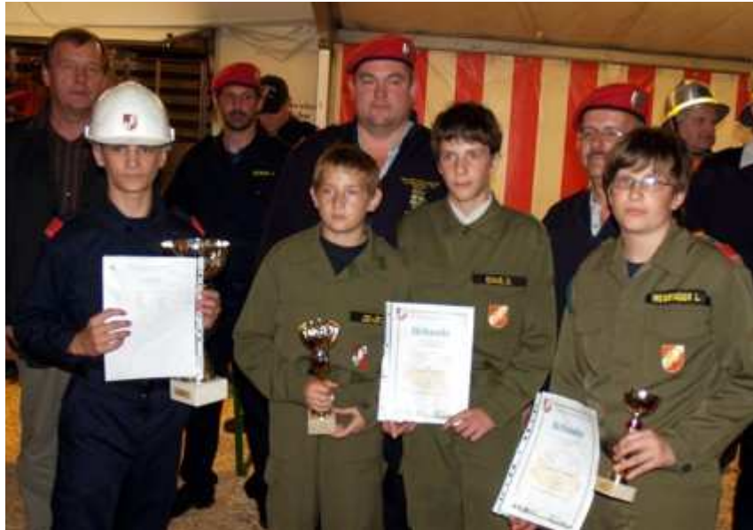
...war bei den Feuerwehrjugendmitgliedern...