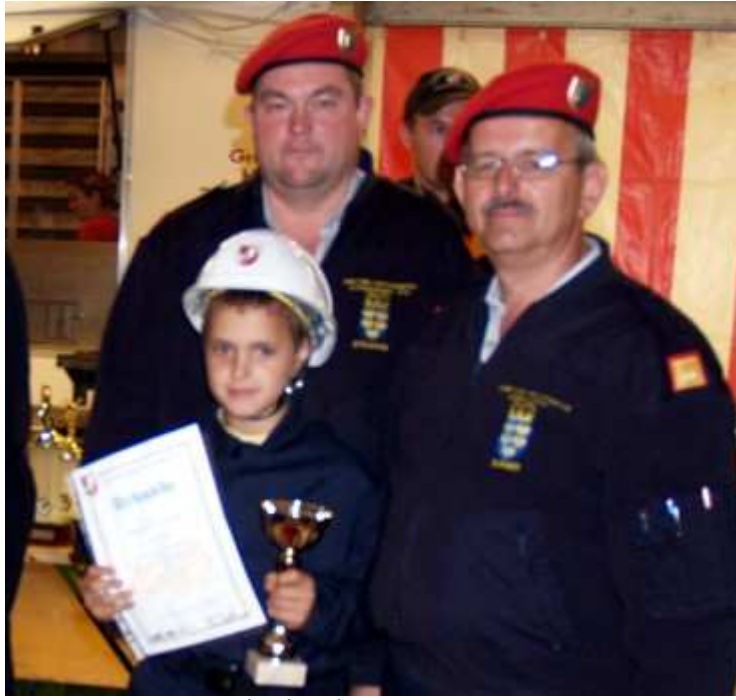
Die Freude über die gewonnenen Preise...