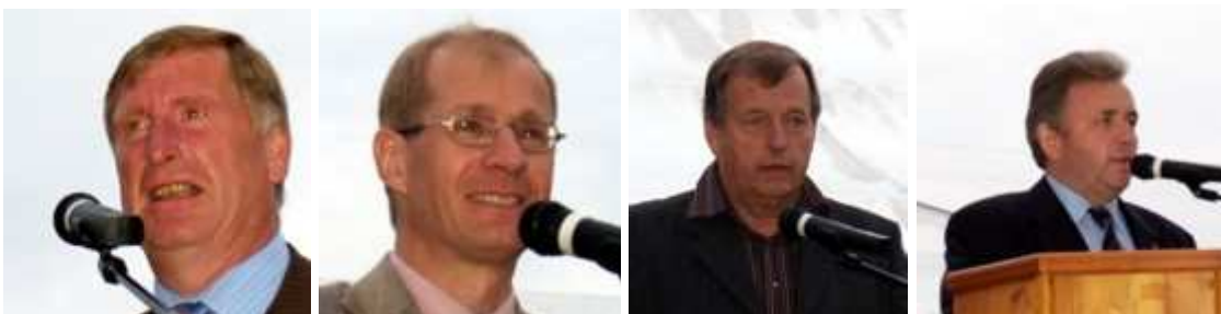
...sowie der Ehrengäste, bevor die Siegerverkündung wegen Regens ins Festzelt verlegt werden muss