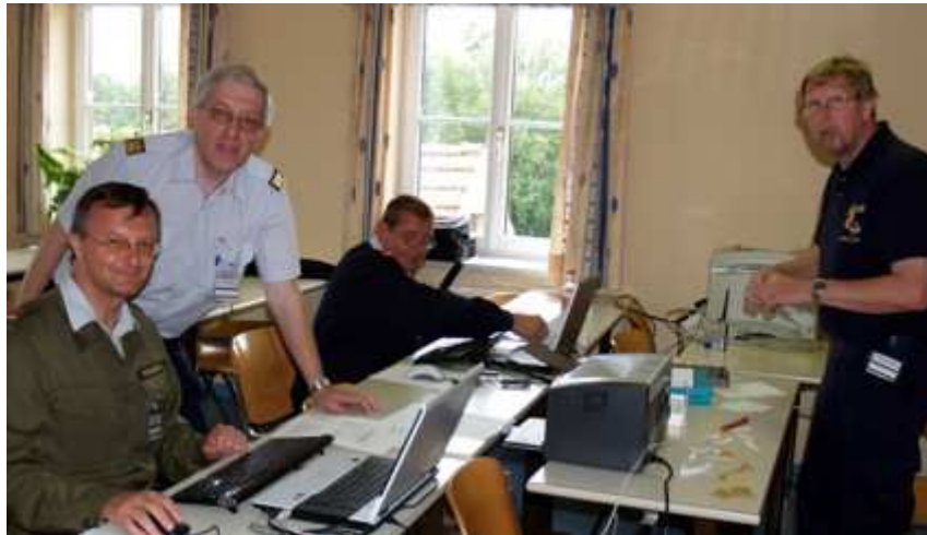
Im (trockenen) Hintergrund: der Berechnungs-Ausschuss B ist gefordert, rechtzeitig zur Siegereverkündung die Ergebnisse fertig zu haben