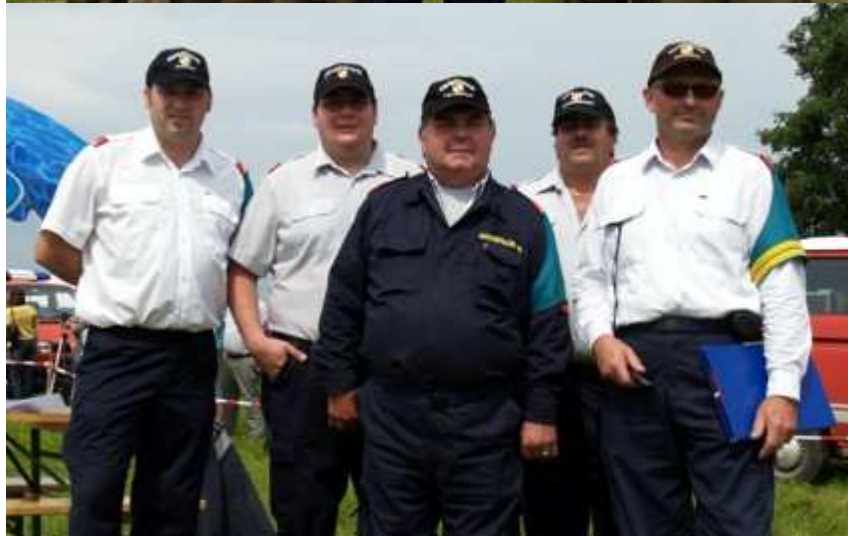
Die Bewerbergruppen für den Löschangriff