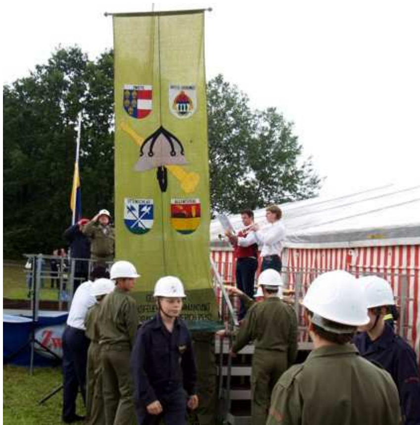
Die FJ als Fahnenkommando