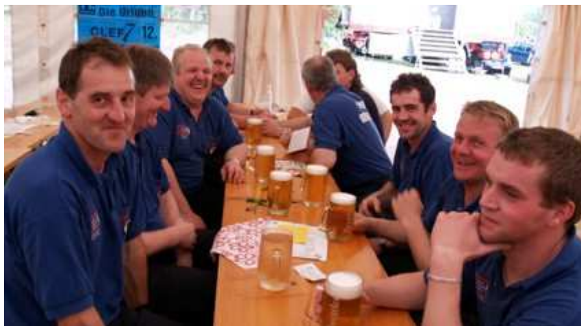
Dazwischen bleibt für die Bewerbungsgruppen ausreichend Zeit, den Flüssigkeitsverlust aufzufüllen

Die Spitzengruppen in der Klasse Bronze A haben sich diesmal besonders "gedrängt". Während Moniholz mit 414,91 Punkten noch einen deutlichen Vorsprung heraus holen konnte, lagen die weiteren 6 Plätze alle innerhalb von 410,9 bis 410,21 Punkten fehlerfrei.