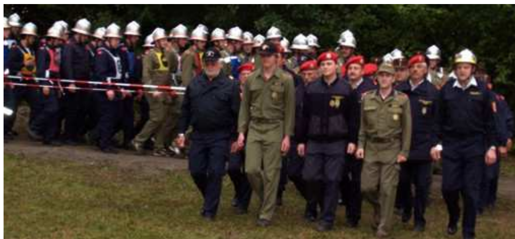
...anschließend die FLA-Gold-Teilnehmer 2009, die Bewerber und Bewerbungsgruppen