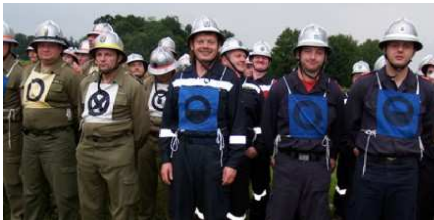
Die Gruppen hoffen auf möglichst gute Platzierungen