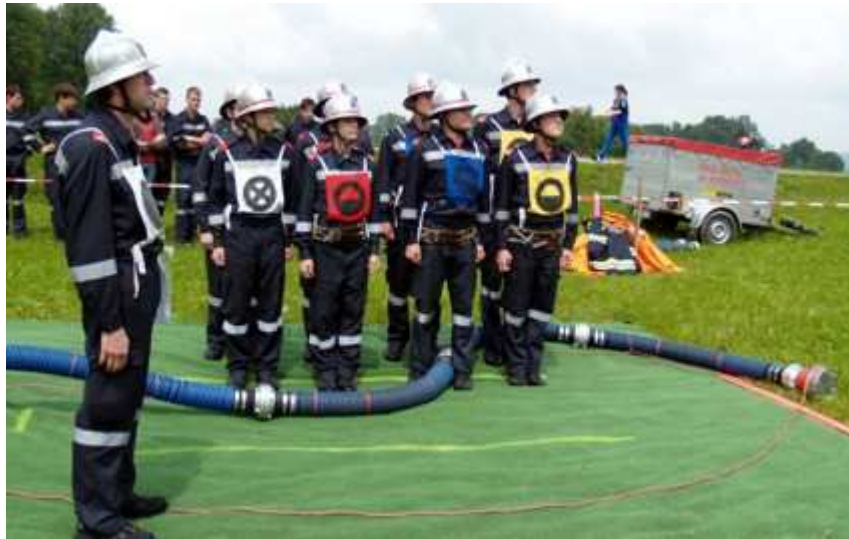
...meldet sich die Gruppe auf der Bahn