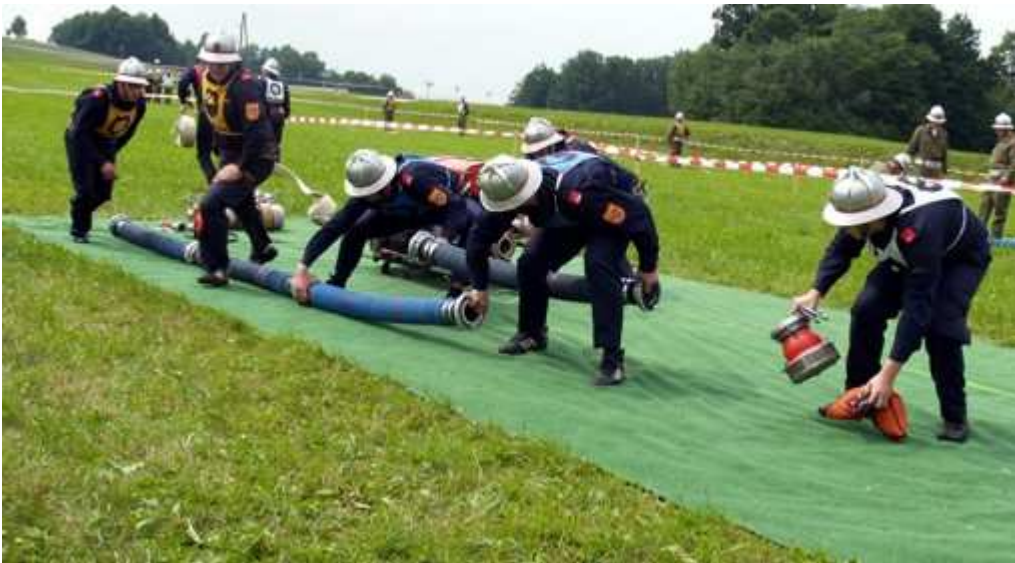
"Vier Sauger!" und los geht's