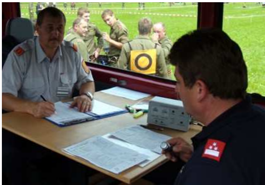
...klappte diesmal wieder problemlos