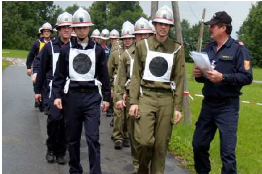
anschließend Aufmarsch zum Staffellauf