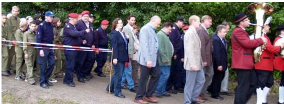
Die Ehrengäste folgend der Musik,....