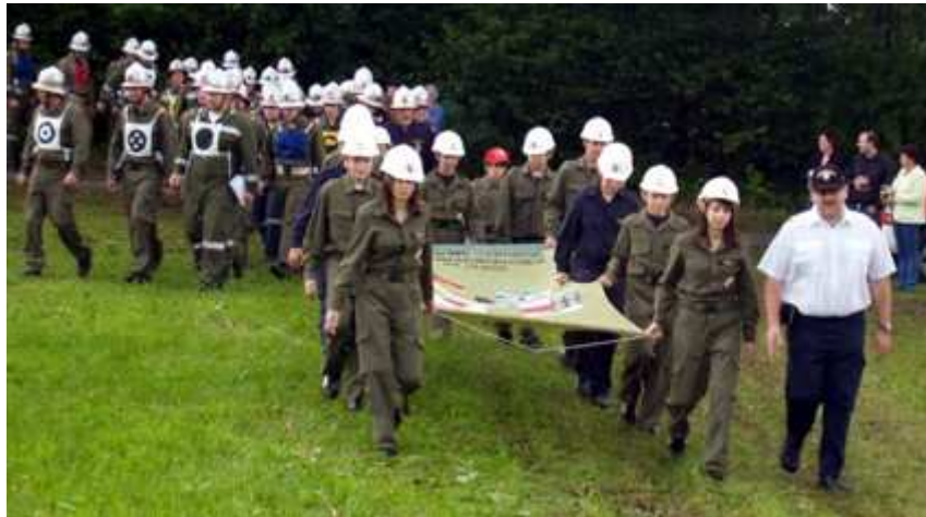
Einmarsch zu Eröffnung