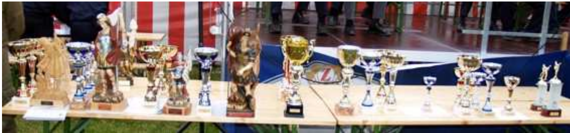
Die Preise warten auf die Verteilung...