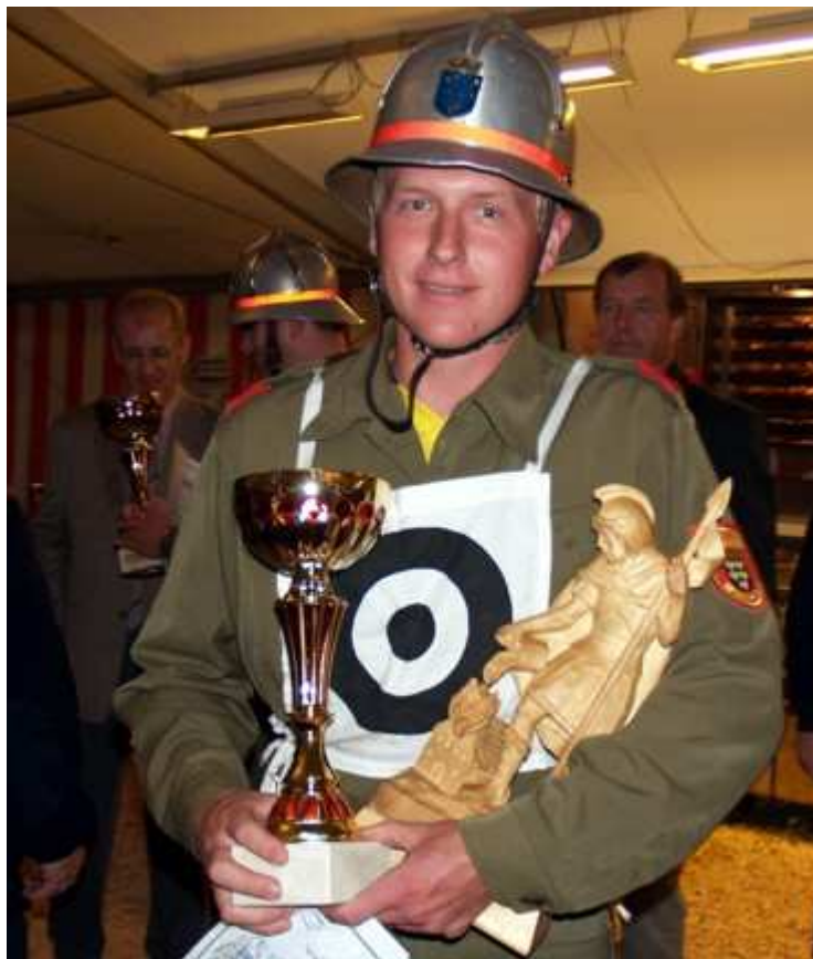
...wie bei den "Großen"