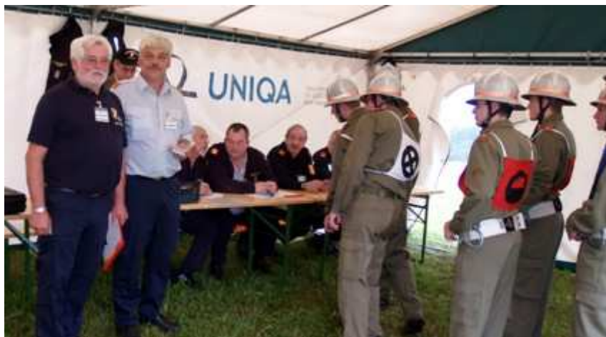
Nach der Meldung und Passkontrolle beim A-Ausschuss...