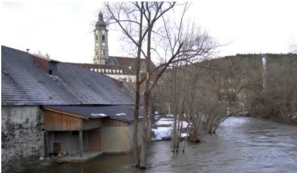
Auch in Stift Zwettl wurde es wieder knapp