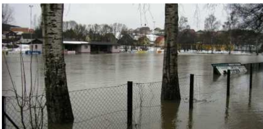
Auch in Schwarzenau ging der Sportplatz unter