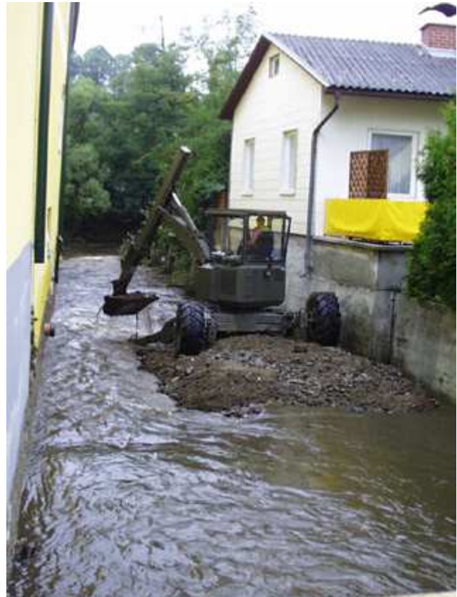
Ein Bundesheerbagger im Sierningbach

Während in Zwettl die zweite Flut nicht ganz so hoch wie die erste war (ca. 30 - 40 cm weniger Wasser) so musste in Schwarzenau ein wesentlich höherer Wasserpegel verzeichnet werden. Hier wurde die Bürgerstraße und ein Teil der Bundesstraße überflutet. Die hier eingesetzten Feuerwehrkräfte mussten Häuser abdichten, Personen evakuieren, Häuser ausräumen und am nächsten Tag auspumpen.