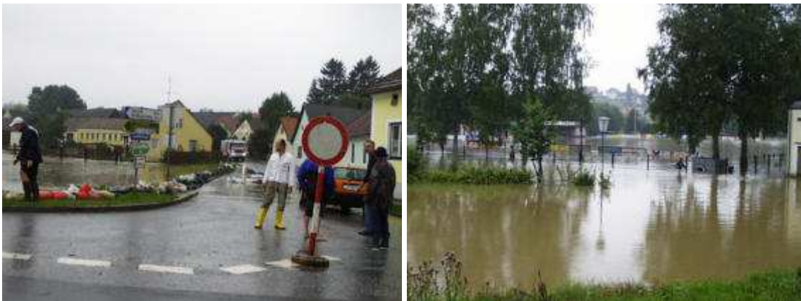
Die Bürgerstraße und der Sportplatz in Schwarzenau überflutet

Während in Zwettl die zweite Flut nicht ganz so hoch wie die erste war (ca. 30 - 40 cm weniger Wasser) so musste in Schwarzenau ein wesentlich höherer Wasserpegel verzeichnet werden. Hier wurde die Bürgerstraße und ein Teil der Bundesstraße überflutet. Die hier eingesetzten Feuerwehrkräfte mussten Häuser abdichten, Personen evakuieren, Häuser ausräumen und am nächsten Tag auspumpen.