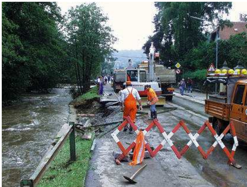
Die Gerungser Straße in Zwettl drohte abzurutschen

Um 9 Uhr rückten 46 Mann mit 10 Fahrzeugen vom Katastrophenhilfsdienst des Bezirkes Scheibbs an. Zu diesem Zeitpunkt waren zwar viele Straßen schon frei von Wasser, jedoch durch Holz und dergleichen stark verunreinigt oder unterspült. Die Gerungserstraße wurde zu diesem Zeitpunkt im Bereich der Hausnummern 10 bis 30 auf ca. 200 Meter gesperrt, die Straße drohte in die Zwettl abzurutschen, darin befindliche Gasleitungen drohten zu platzen.