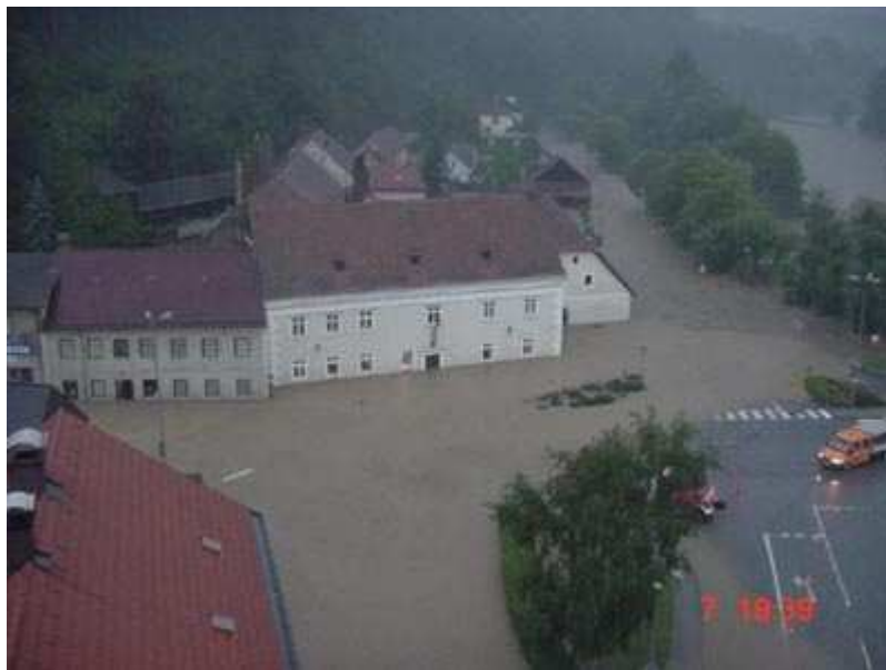
Die ersten Überschwemmungen traten in Oberhof auf

Haupteinsatzgebiet ist die Stadt Zwettl, aber auch in Groß Gerungs, Jagenbach, Dorf Rosenau, Schwarzenau und in vielen anderen Gemeinden kämpfen die Mannschaften gegen das Wasser. Zwettl ist in den Abendstunden auf der Straße nicht mehr erreichbar, sämtliche Zufahrtsstraßen sind gesperrt, eine Durchfahrt ist unmöglich.