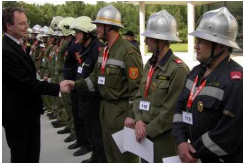
Auch Landesrat Pernkopf gratuliert