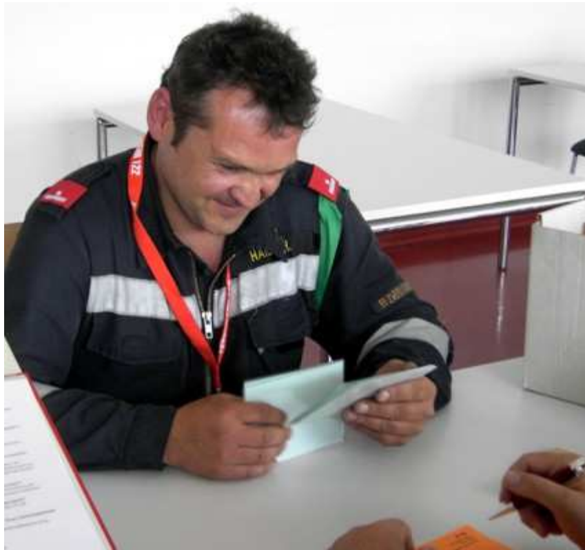
15 von 307 Fragen sind zu ziehen und zu beantworten,...