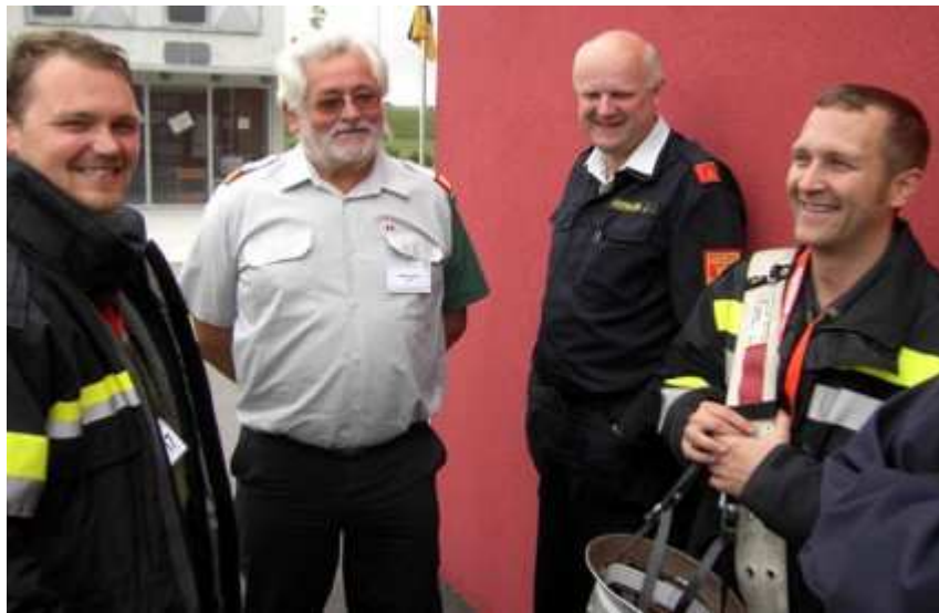
...ist die Anspannung schon etwas gelöst