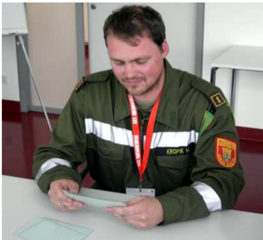
...dies und die anderen großteils schriftlichen Disziplinen verlangen noch viel Konzentration am Nachmittag