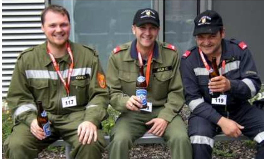
Nach diesem anstrengenden Tag schmeckt auch wieder ein Bier (sogar, wenn es kein Zwettler ist), das die Wartezeit auf die Siegereverkung verkürzt