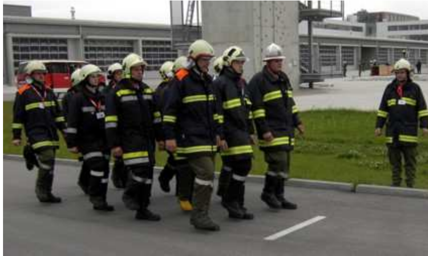
nach dem 1. Halbtage im "Außendienst" mit Kommandieren, Hindernisplan und Brandschutzplan...