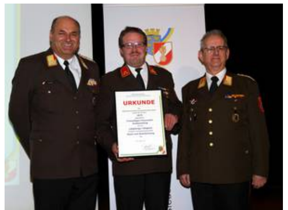
Übergabe der Urkunde zum 140-jährigen "Geburtstag" an die FF Grafenschlag

OBR Knapp überreichte die Urkunde an den Feuerwehrkommandanten