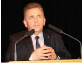
Landtagsabgeordneter Franz Mold