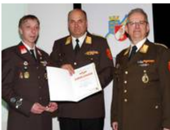
OBM Roland Wurz