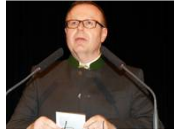
Bürgermeister Manfred Zipfinger sprach für seine Amtskollegen