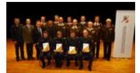
Das Bezirksfeuerwehrkommando mit den Abschnittsfeuerwehrkommandanten, den Ehrengästen und den geehrten Polizeibediensteten.