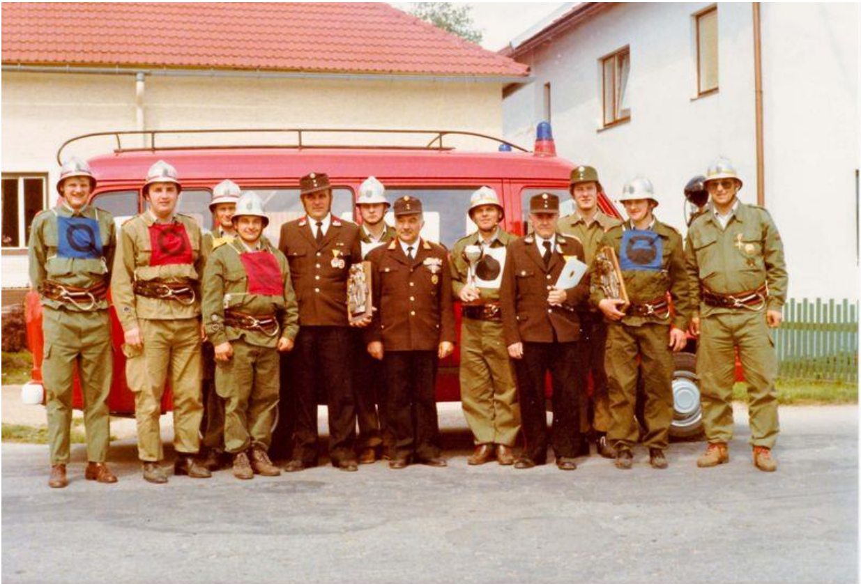
1980 beim Bewerb in Jagenbach