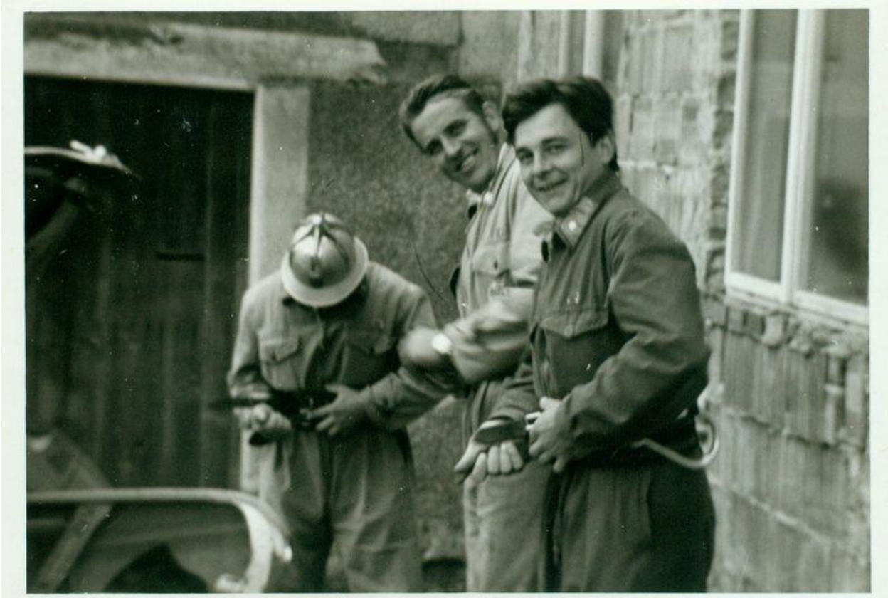
Eines der ersten Fotos im Archiv: 16.7.1966 bei einem Bewerb in Braunau am Inn