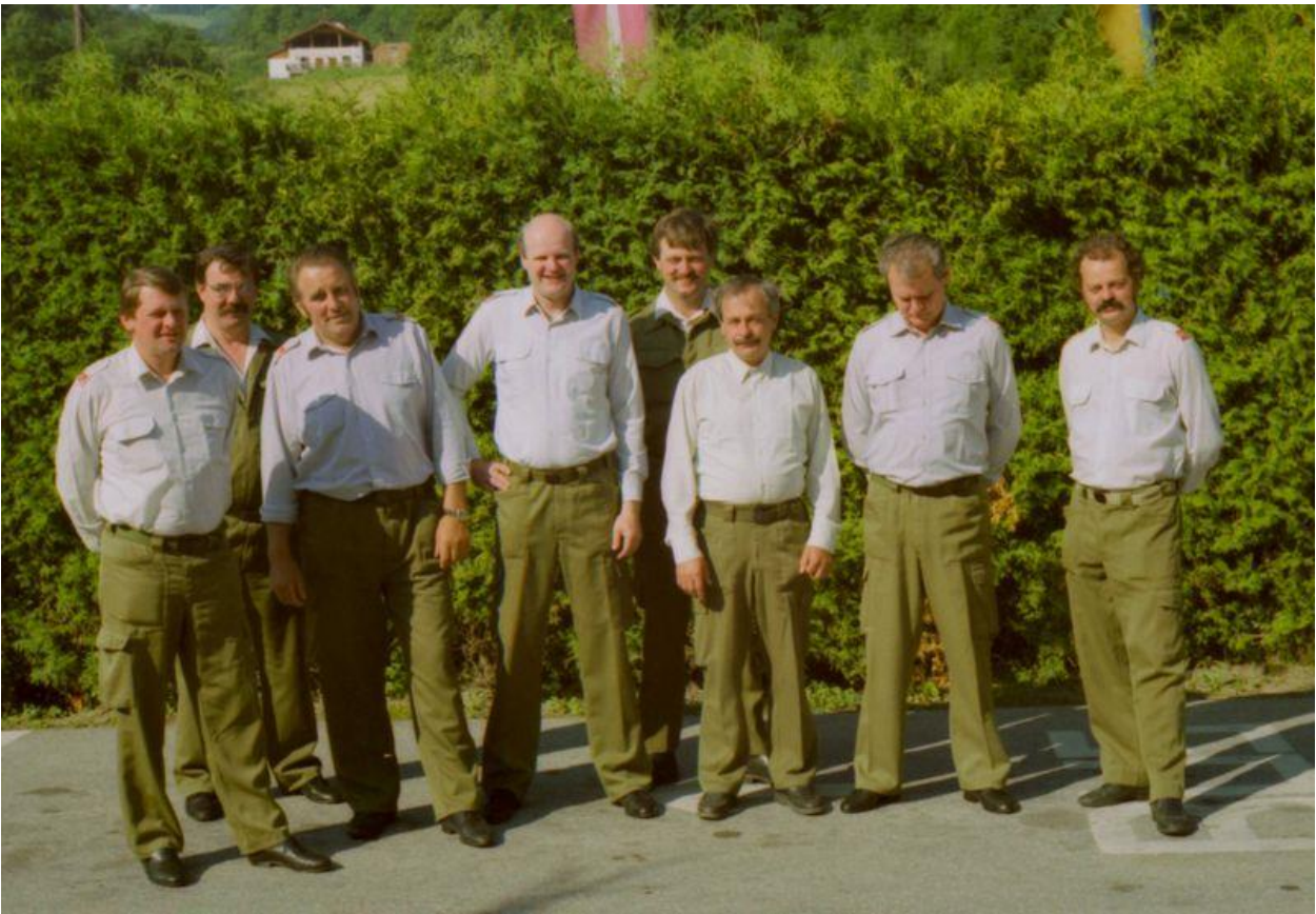
Landesfeuerwehrleistungsbewerb im Juni 1991