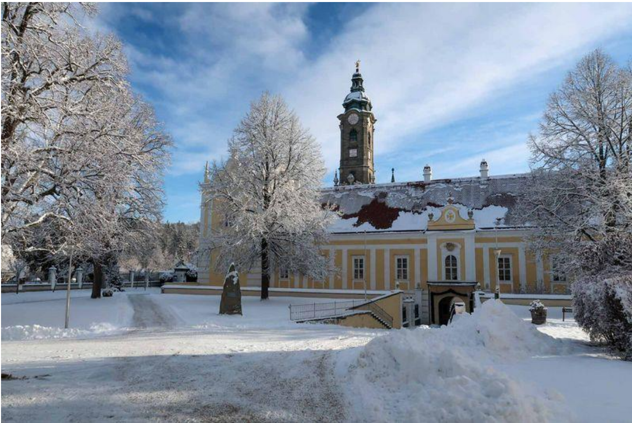
Strahlendes Winterwetter beim Begräbnis