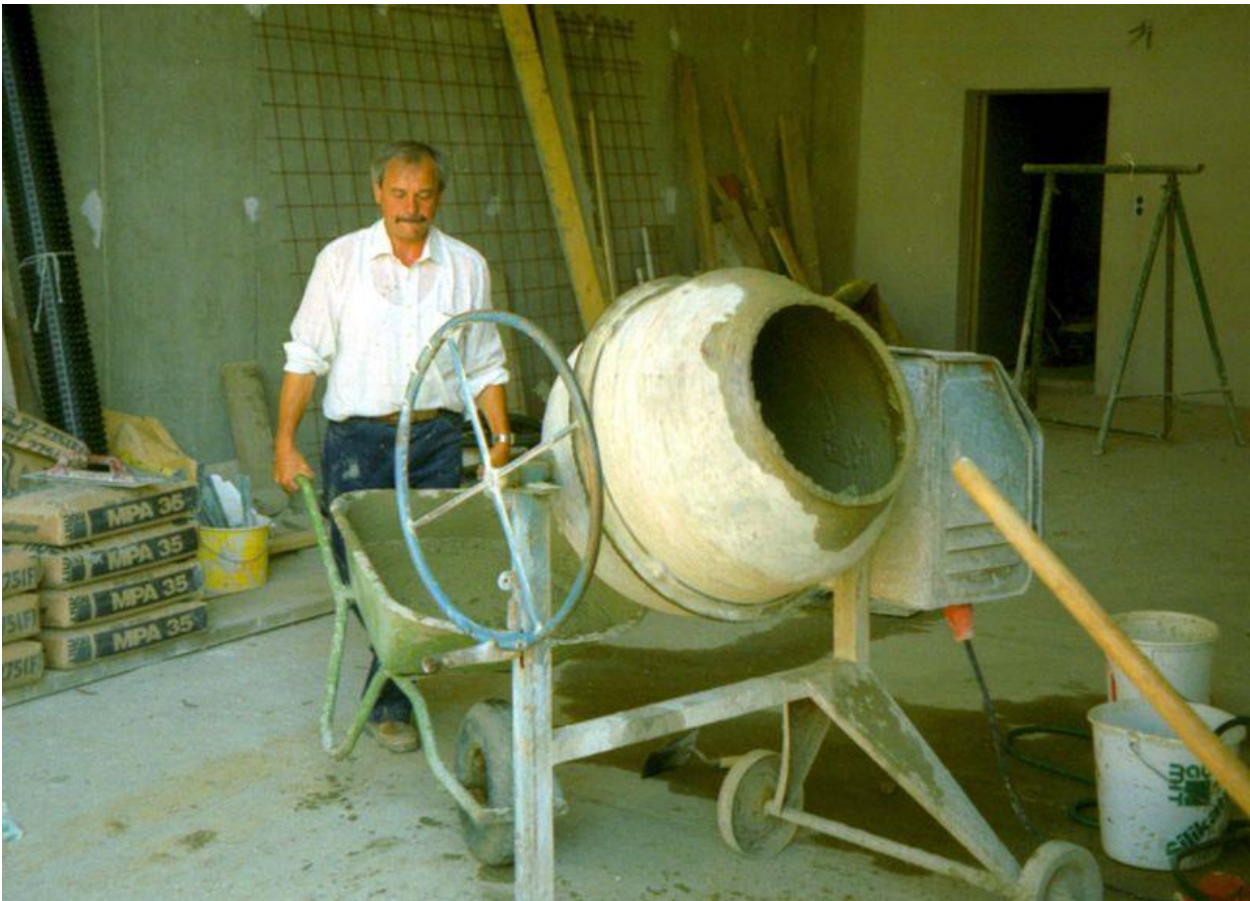
...oder bei Betonarbeiten für die Stützmauer 8/1995