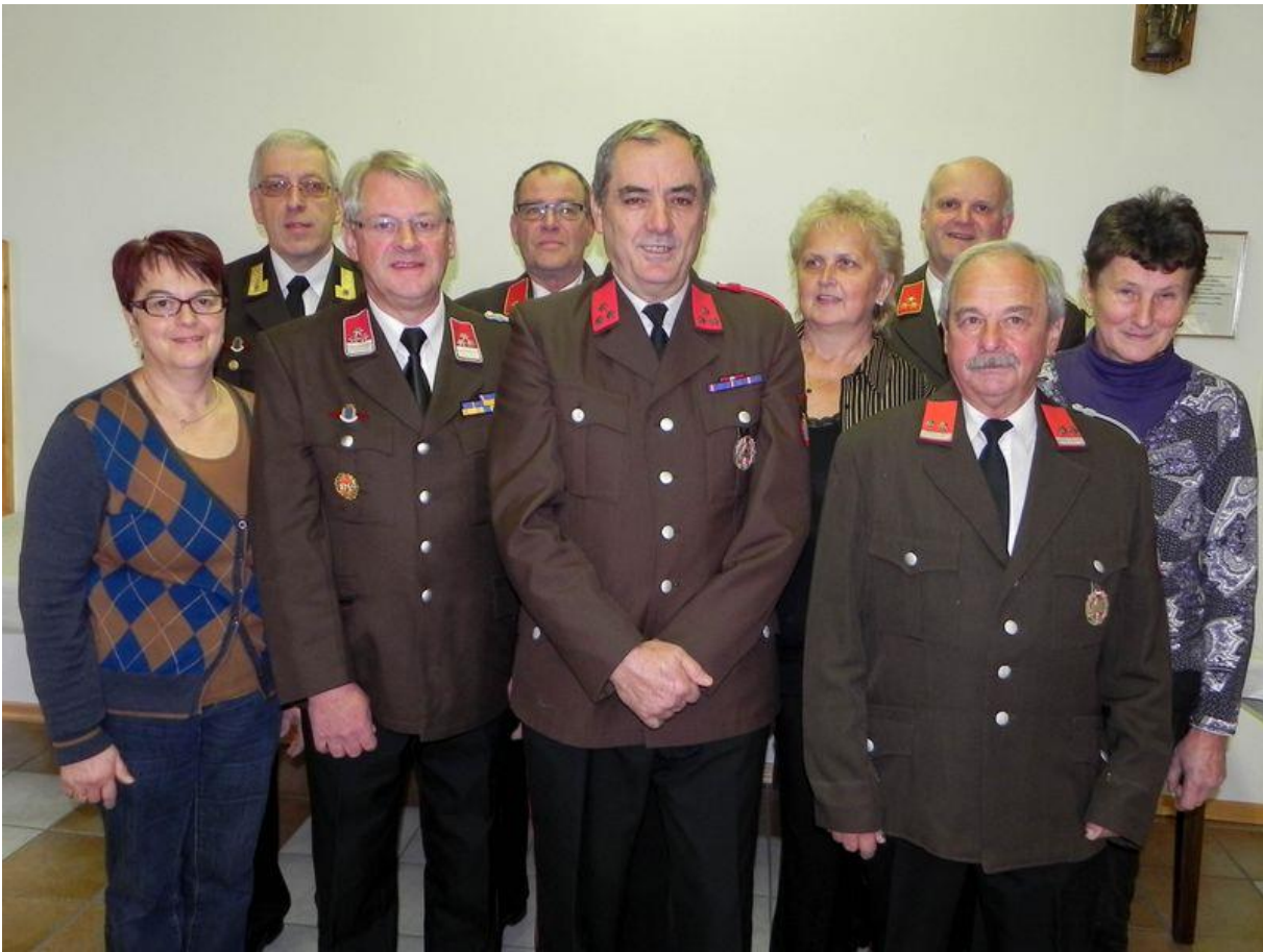
28.10.2012 bei der Geburtstagsfeier (65) und Übertritt in die Reserve