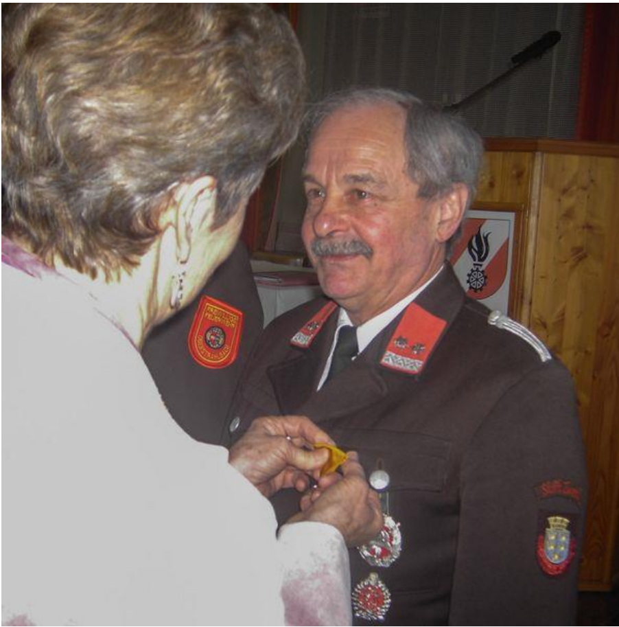
Ehrung für 40 Jahre Feuerwehrdienst am 30.3.2008