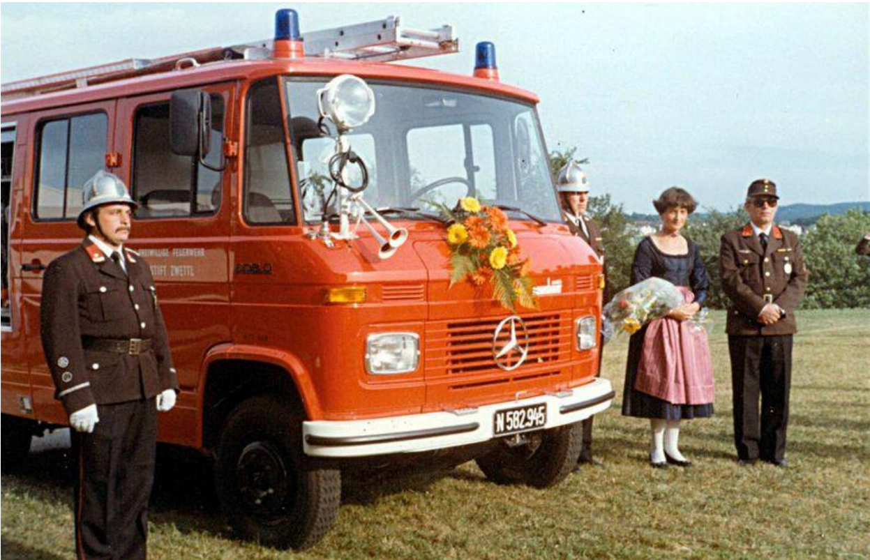
Segnung des TLF 1000 am 13.6.1981