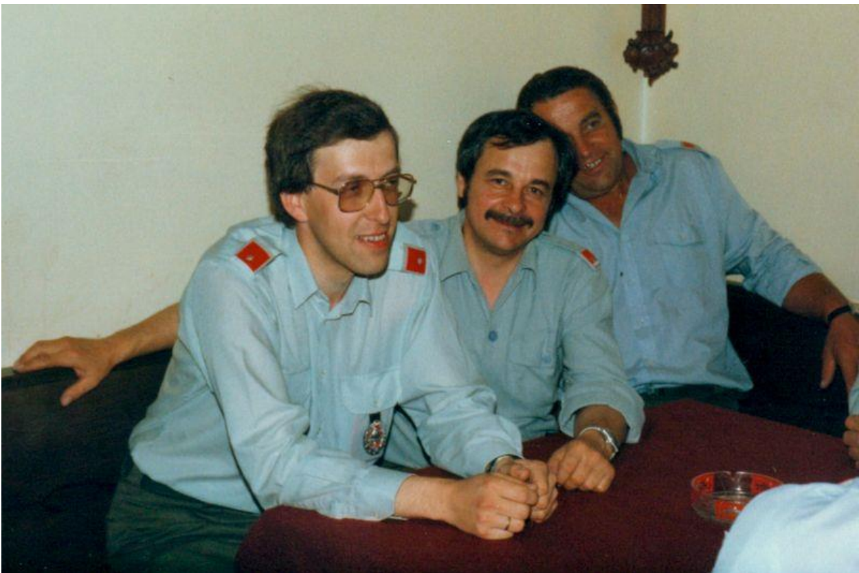
Bei einem Bewerb im Juni 1986