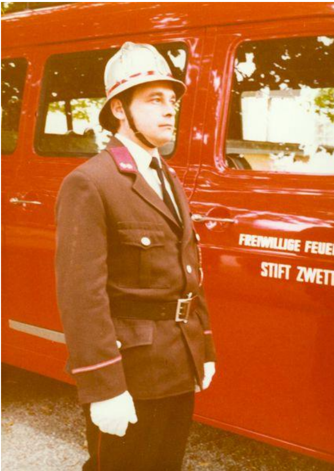
KLF-Segnung am 26.6.1977 beim 50-Jahr-Jubiläum der Feuerwehr