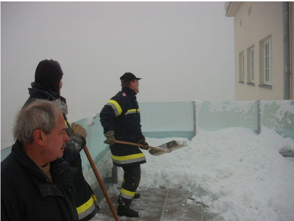
Einsatz zur Schneerräumung bei der Hauptschule Zwettl am 7.1.2006