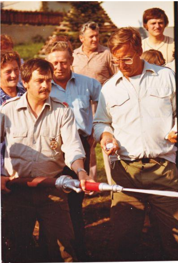
Bei der Vorstellung des neuen TLF 1000 im Jahr 1980