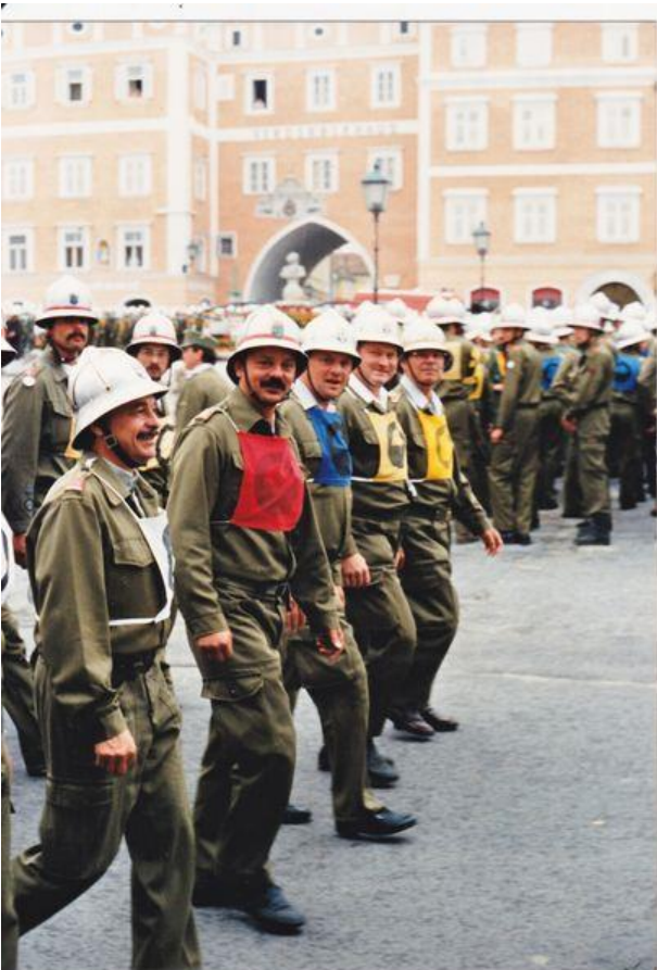
6/1992 beim Landesfeuerwehrleistungsbewerb in Retz