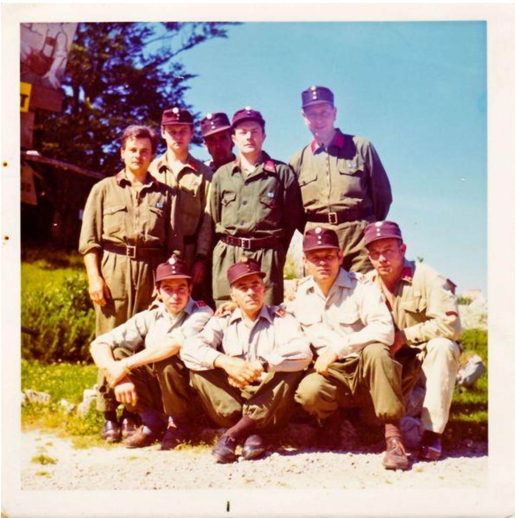
Beim Bewerb 1972 am Muckenkogel (zweite Reihe ganz links)