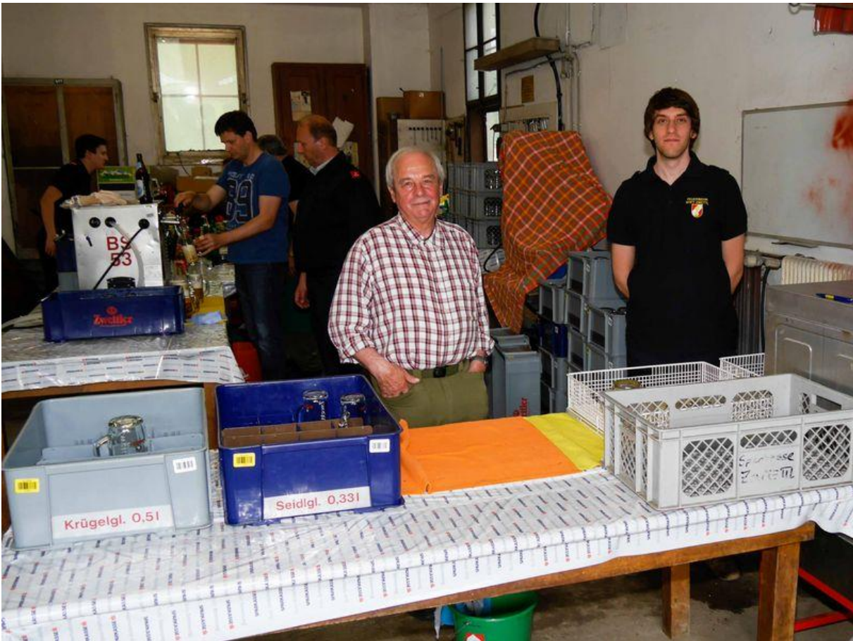
Almeder betreute beim Meierhoffest meist die Abwasch und sorgte für reine Gläser