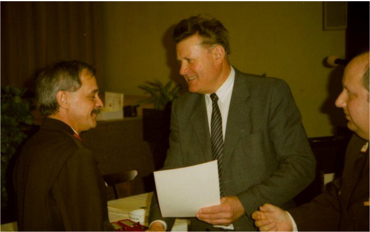
Auszeichnung für 25 Jahre Feuerwehrdienst am 18.4.1993