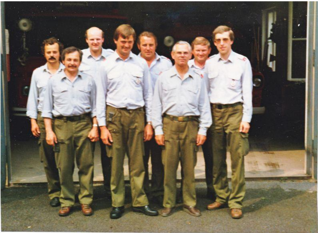
Beim Bewerb im Juni 1986 (2.v.r.)