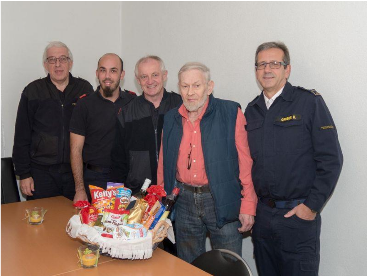
Das letzte Foto im Archiv stammt von der Gratulation des Feuerwehrkommandos zum 70. Geburtstag im Nov. 2019