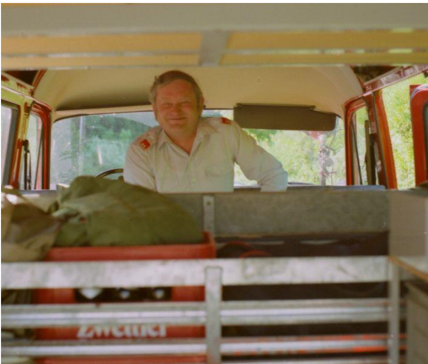
Beim Landesfeuerwehrleistungsbewerb 1991