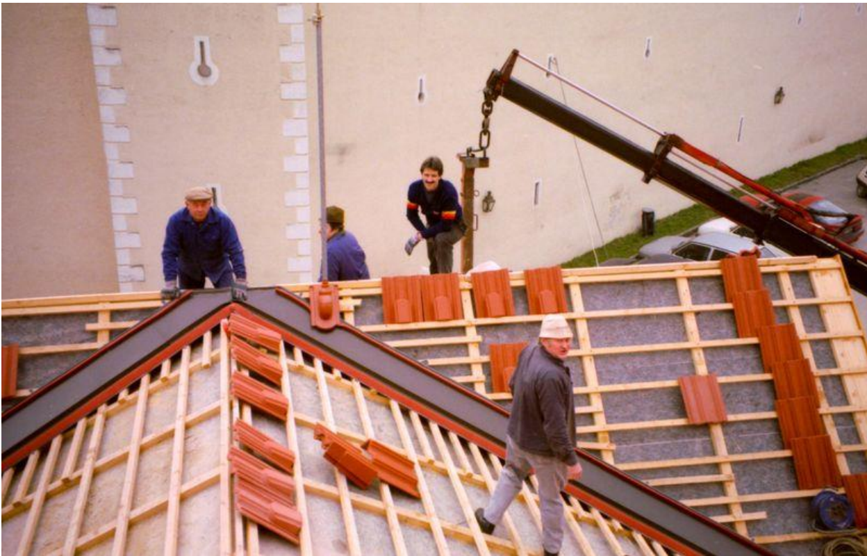
Beim Feuerwehrhausbau 1995...