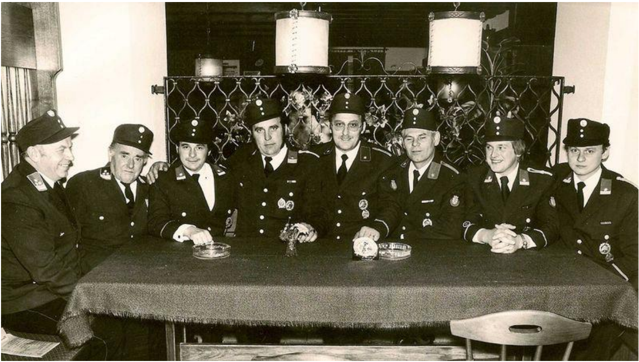
Oktober 1978 bei einer Chargensitzung (2. v.r.)