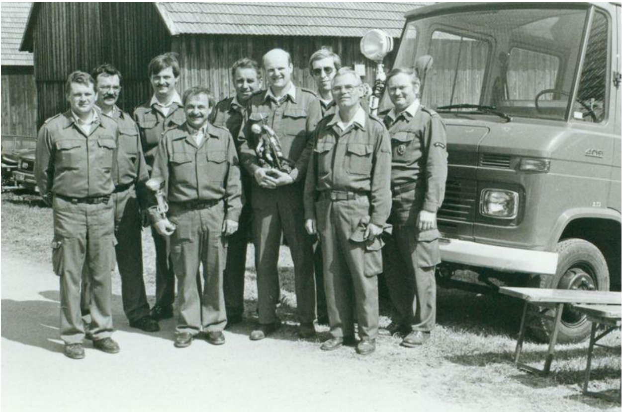
Beim Landesfeuerwehrleistungsbewerb 1991 (ganz re.)