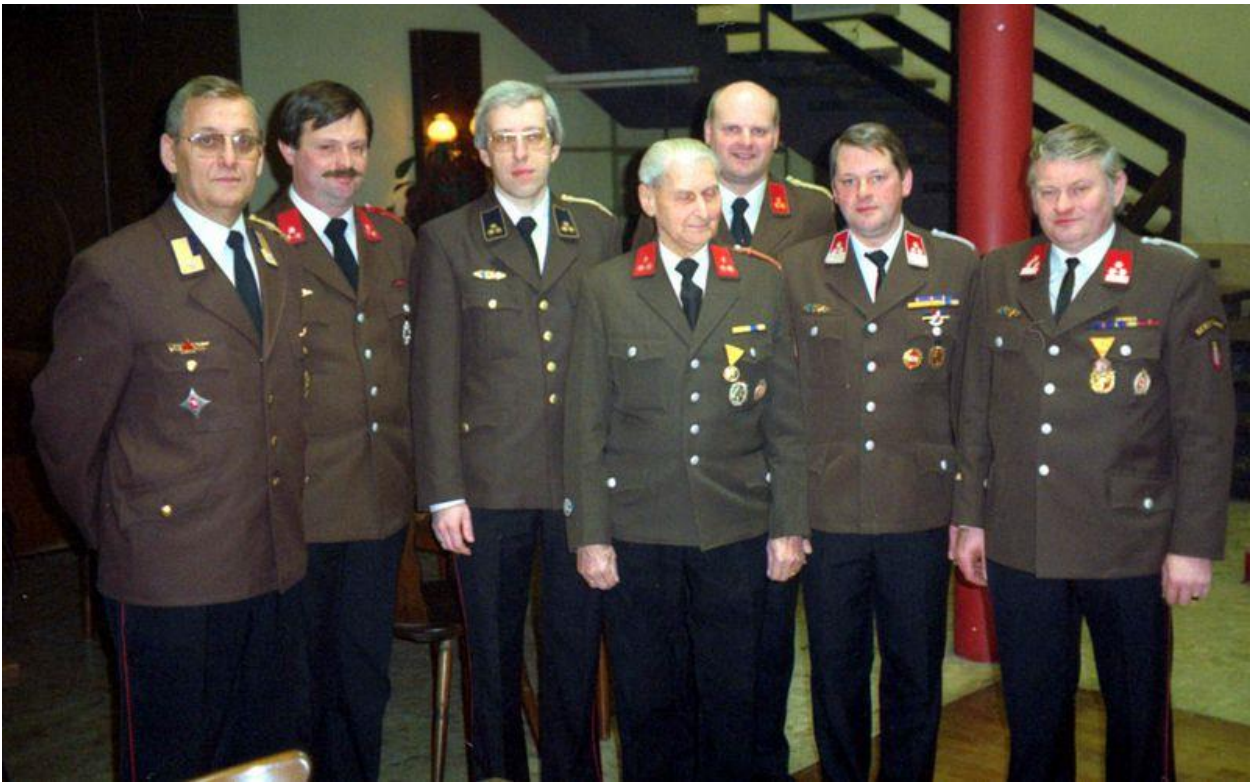
beim Abschnittsfeuerwehrtag 1998 (ganz re.)