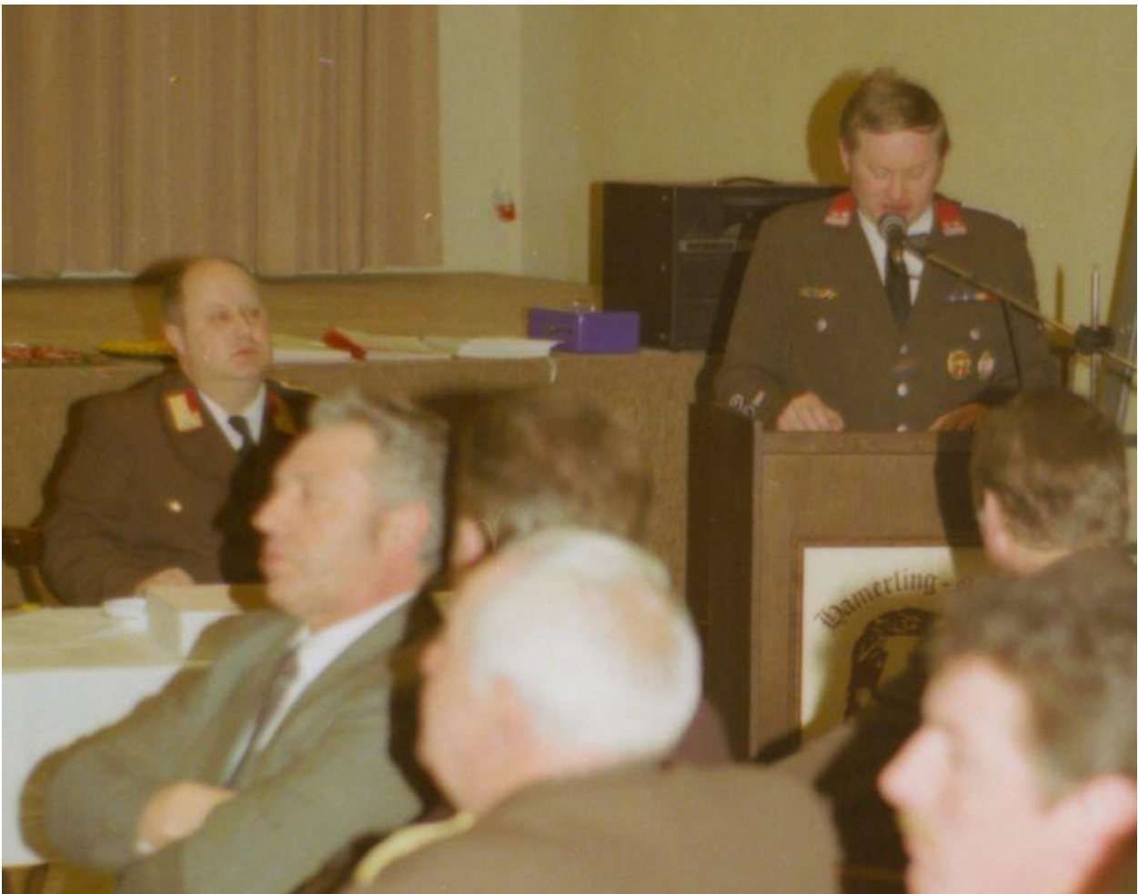
Beim Abschnittsfeuerwehrtag 1992 als Abschnittssachbearbeiter