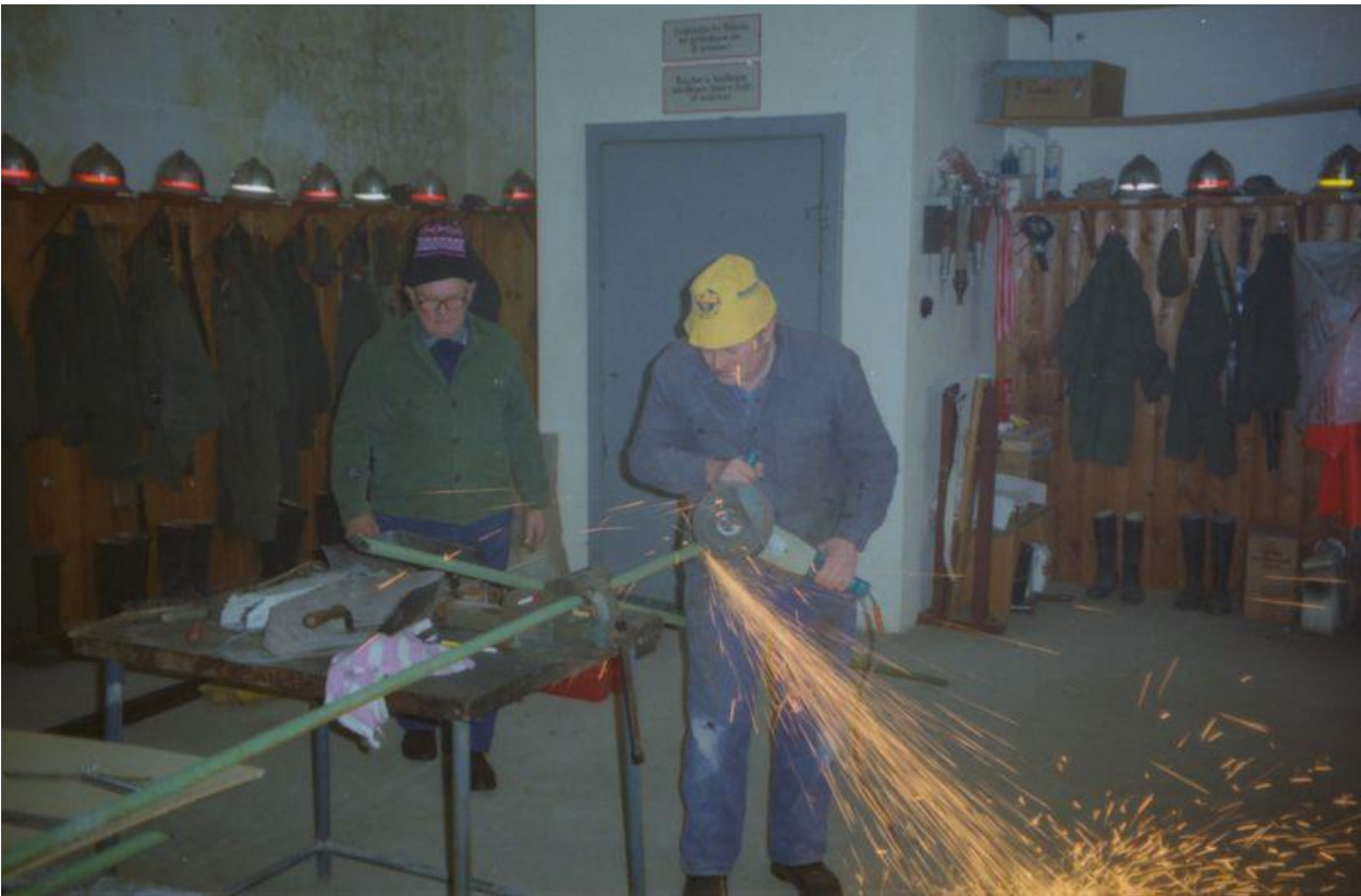
...und beim Bau des Stiegegelanders 1996