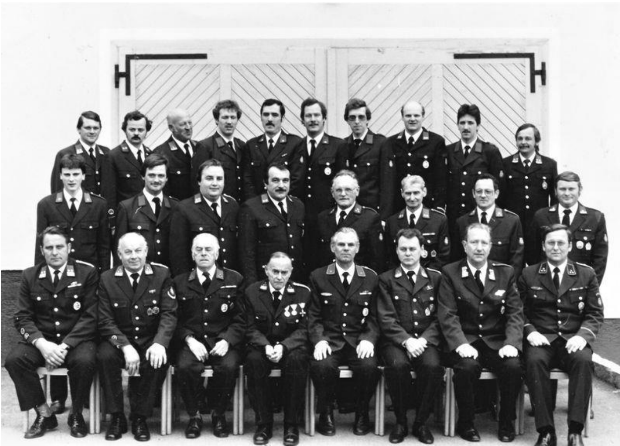
Beim Foto für das große NÖ Feuerwehrbuch am 8.5.1985: 2. Reihe ganz rechts